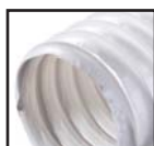
Белый ( )